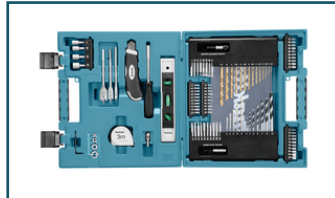
Boor-/schroefbitset 104-delig (6 stuks)