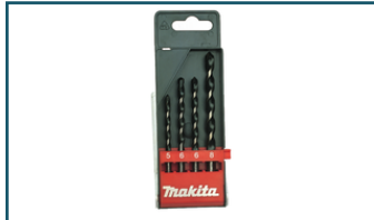
Betonborenset 4-delig (6 stuks)