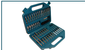
Boor-/schroefbitset 42-delig (6 stuks)