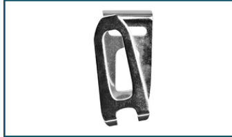
Draaghaak lang (1 stuks)