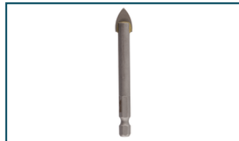
Glasboor 10x80mm (1 stuks)