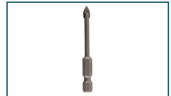
Glasboor 5x65mm (1 stuks)