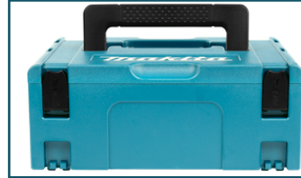
Mbox nr.2 (1 stuks)