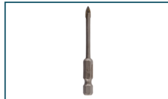
Glasboor 4x65mm (1 stuks)